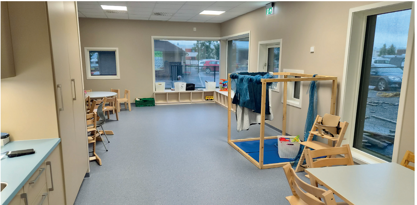
Fra en avdeling i 1. etasje.