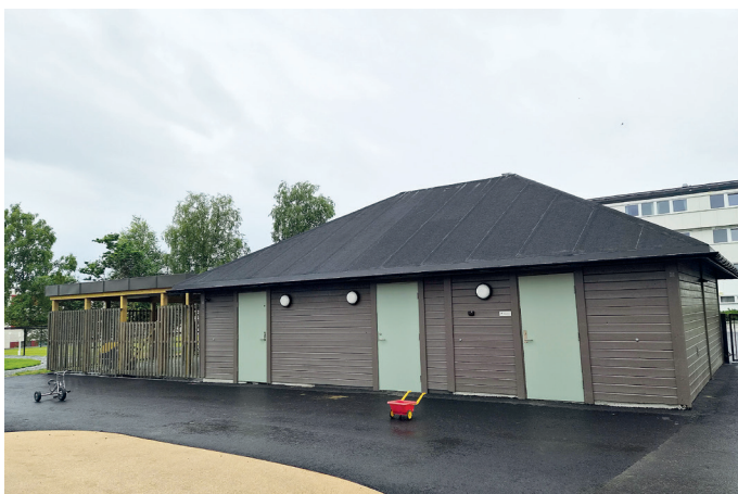
Boder for utelagring.