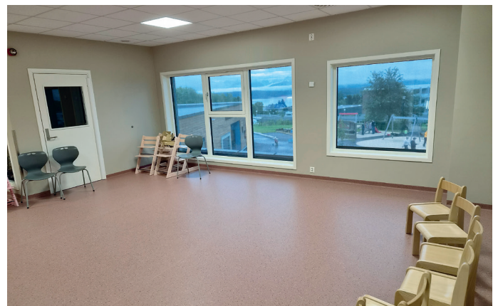
God utsikt til uteområdet fra en avdeling i 2. etasje.

innenfor samspill med andre og utvikling av vennskap. Videre er leken med på å utvikle barnas språk, kreativitet, motoriske ferdigheter og ikke minst nysgjerrigheten. Leiken er barnas viktigste arena for både læring og utvikling. Derfor er