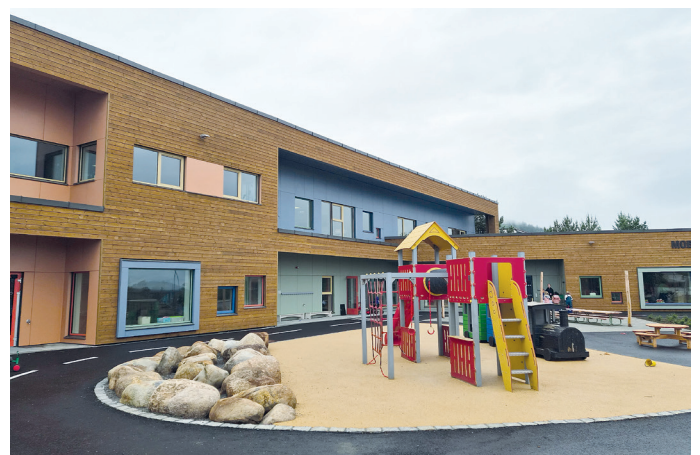
Fasade mot sør sett fra vest.