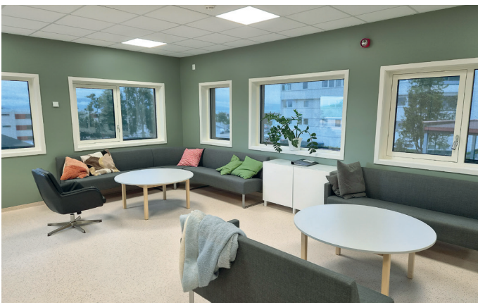
Mange vinduer og god utsikt fra personalrommet i 2. etasje.