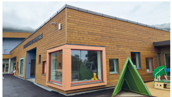
En fløy av barnehagen har kun én etasje.

første etasje mens det i andre etasje er to avdelinger i tillegg til garderober for ansatte, personalrom og kontorer. Hver barnehageavdeling er utstyrt med egne toaletter for barna, garderobe og en benk med vask og skapplass i tillegg til åpne oppholdsrom med fleksible soner for lek og kreativitet. To og to avdelinger er bygget sammen som samarbeidsavdelinger og det er også noen små rom som kan brukes til ro og konsentrasjon.