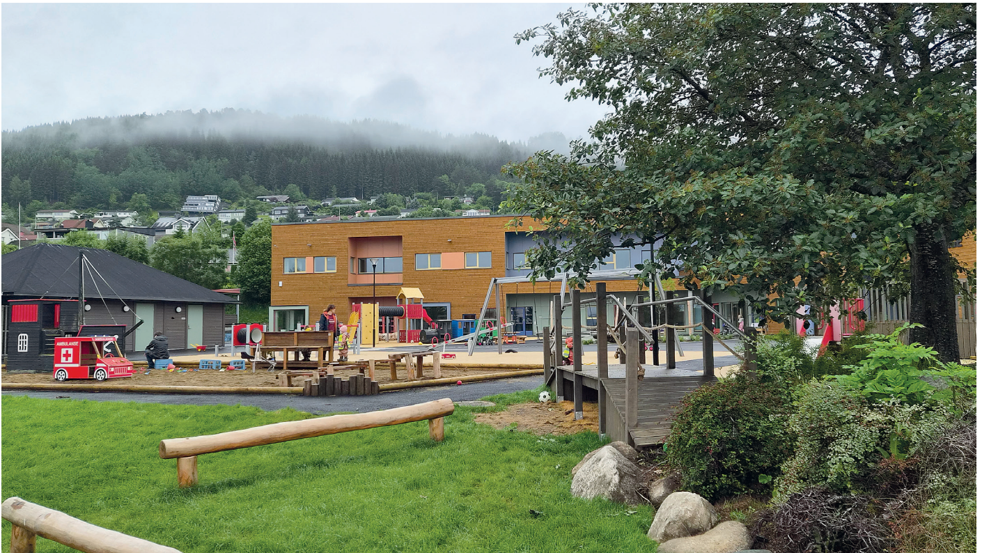
Det er bevart et grøntområde lengst sør på uteområdet.