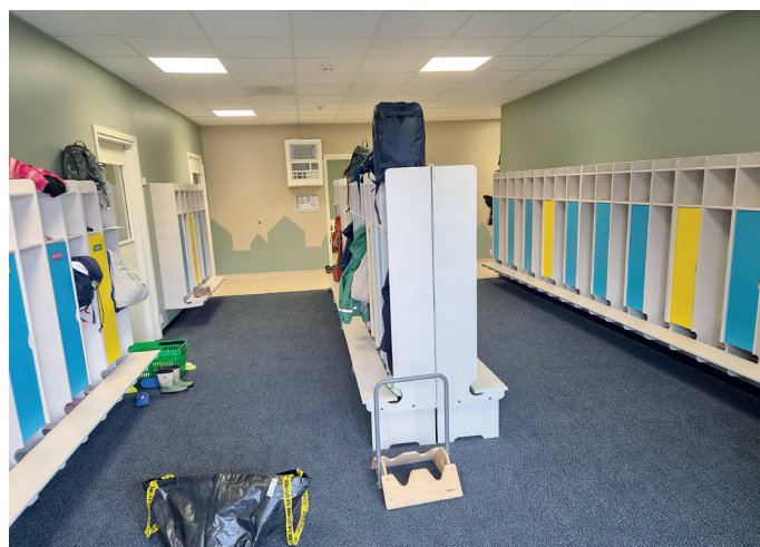
Fra en av garderobene til barnehagebarna i 1. etasje.