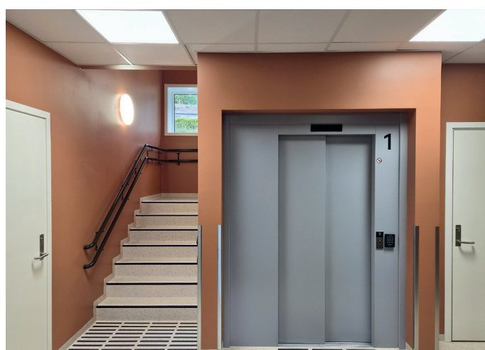
Det er både heis og trapp opp til 2. etasje.